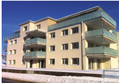
Attraktive Wohnungen: Stieger Immobilien AG ...

11 Mietwohnungen, 2,5 / 3,5 / 4,5 + 3,5 Attika, alle Wohnungen mit schönen Parkett- und Steinböden, offene Küchen mit Bar, Reduit, WM/TU grosse Terrassen u.v.m. Überzeugendes Preis-Leistungs-Verhältnis, Erstbezug im Februar 2011, die Wohnungen waren bereits Monate im Voraus vermietet.