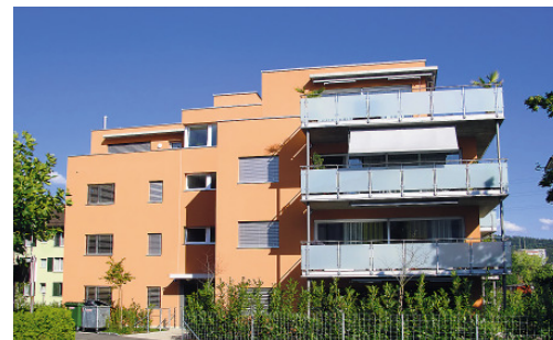
... bietet auch in Winterthur schönes Wohnen.

Baujahr 2008, 11 Mietwohnungen, 3,5 + 3,5 Attika alle Whg. mit schönen Parkett- und Steinböden, Einbauschränke, WM/TU, grosse Terrassen u.v.m. Sehr erschwingliche, zentral gelegene Mietwohnungen, Preise bereits ab 1640 Franken pro Monat. Zurzeit sind alle Wohnungen vermietet.