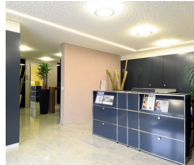
Topmoderne Räume: aktuellste Farben, Materialien und Beleuchtungssysteme.